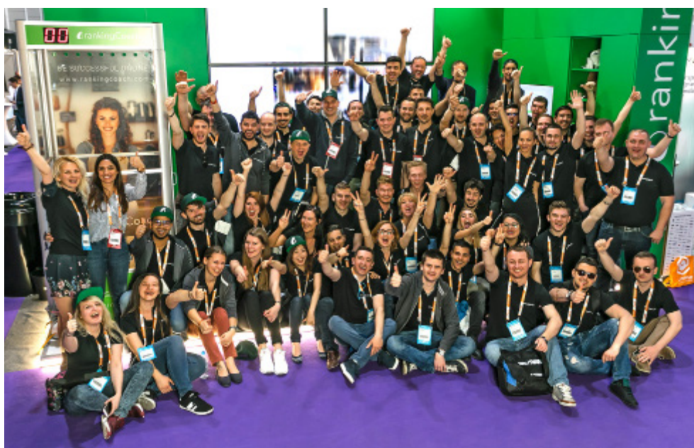
Il team rankingCoach